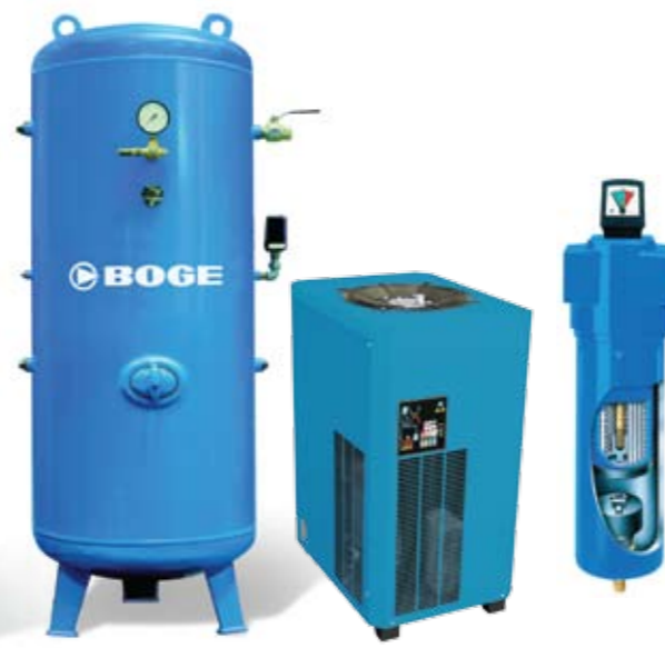
Tratamento a Armazenamento de Ar Comprimido Filtros / Reservatórios / Secadores